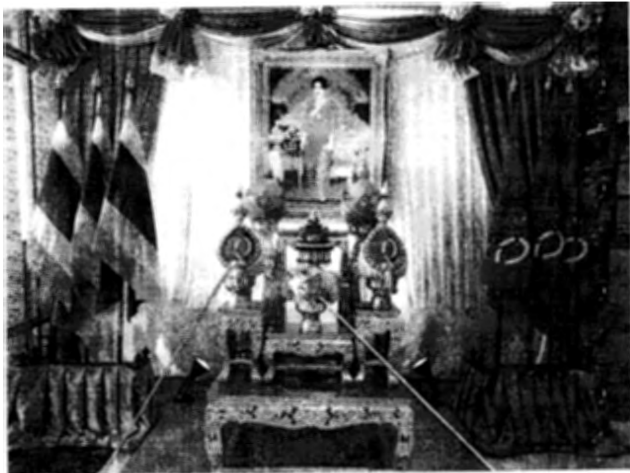
ตัวอย่างการจัดสถานที่เอนามถวายพระพรชัยมงคล