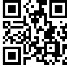
งานประกันคุณภาพโรงเรียนบ้านศรีธรณ